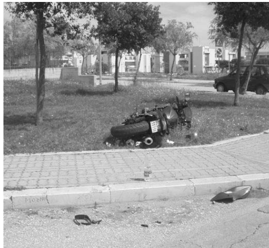
Il luogo dell'incidente di domenica

Nella stessa mattinata di domenica altri due incidenti stradali si sono verificati a pochi chilometri da Manfredonia: uno sulla strada per Mattinata e l'altro lungo la strada per Ruggiano. In entrambi i casi è stato necessario l'intervento delle ambulanze del 118. [A. M. V.]