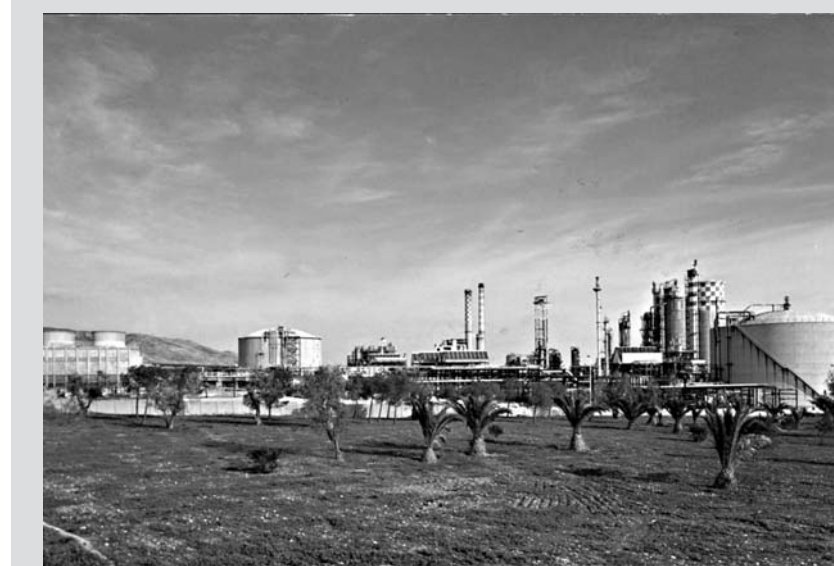
La zona industriale di Manfredonia