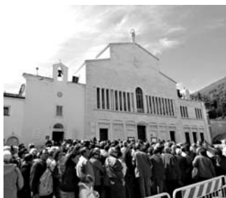
San Giovanni Rotondo

«Tra il 2000 e il 2002, quando Giubileo e processo di beatificazione fecero schizzare in alto i pellegrinaggi e l'interesse mediatico, non raggiungeva i 70 milioni. Nel piccolo paese del Gargano, dove l'80% dei cittadini è impiegato nel turismo religioso - si legge nell'articolo -, si contano 132 bar, 110 ristoranti e trattorie, 98 tra alberghi e pensioni per quasi 7 mila posti letto.