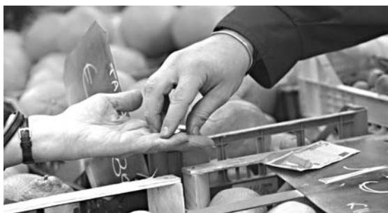
Prezzi senza controlli a Manfredonia

In Italia gli organi preposti ai controlli sono polizia amministrativa, polizia, carabinieri; le Asl, le camere di commercio e gli stessi consumatori possono chiedere di effettuare i controlli.